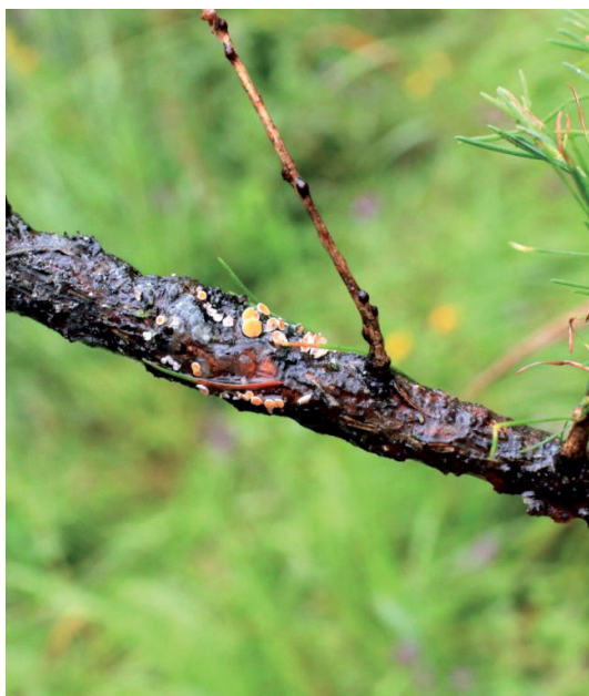
Obrázok 7. Oranžové cca 2 mm veľké plodnice vlnušky Willkomovej Lachnellula willkomii sa tvoria v mieste infekcie kôry a pod ňou rakovinové zhrubnutie napadnutej vetvy

Figure 6. Thick layer of aphids wask and body remainings on the bark of young larch trees