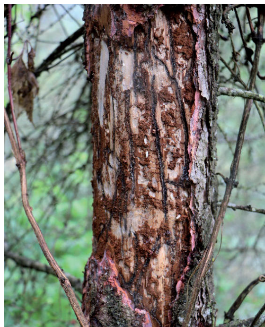
Obrázok 5. Požerok lykožrúta smrekovcového Figure 5. Galleries of Ips cembrae