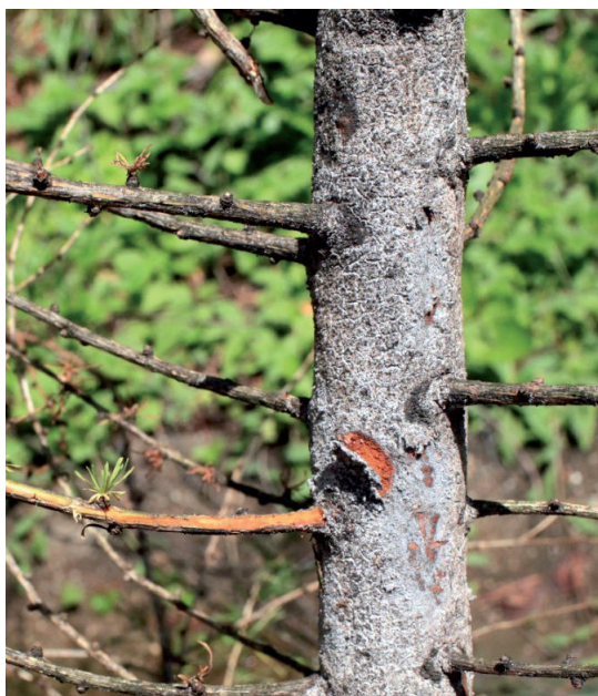
Obrázok 6. Hrubá vrstva zvyškov po zimujúcich a cicajúcich voškách na kmeni smrekovca

Figure 6. Thick layer of aphids wask and body remainings on the bark of young larch trees