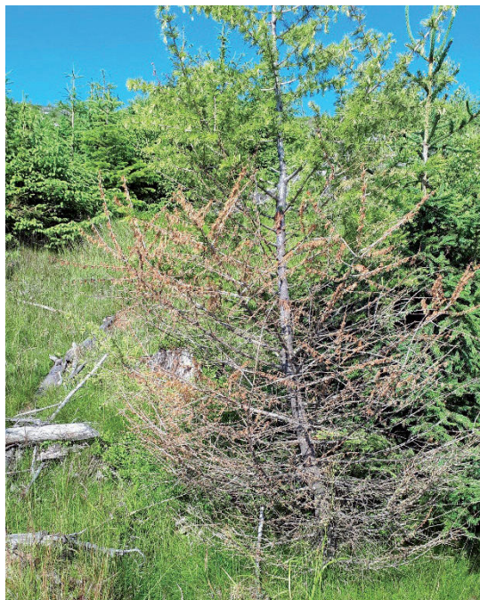
Obrázok 2. Odumieranie spodných vetiev Figure 2. Dying of lower branches

V odumretých častiach korún, už aj na 1 – 2 cm hrubých vetvičkách, sa zistili larvy imága podkôrneho hmyzu – lykožrúta lesklého Pityogenes chalcographus (L.) a lykožrúta smrekovcového Ips cembrae (Heer). Ich výskyt bol ojedinelý a zaznamenal sa na smrekovcoch starších ako 20 rokov.