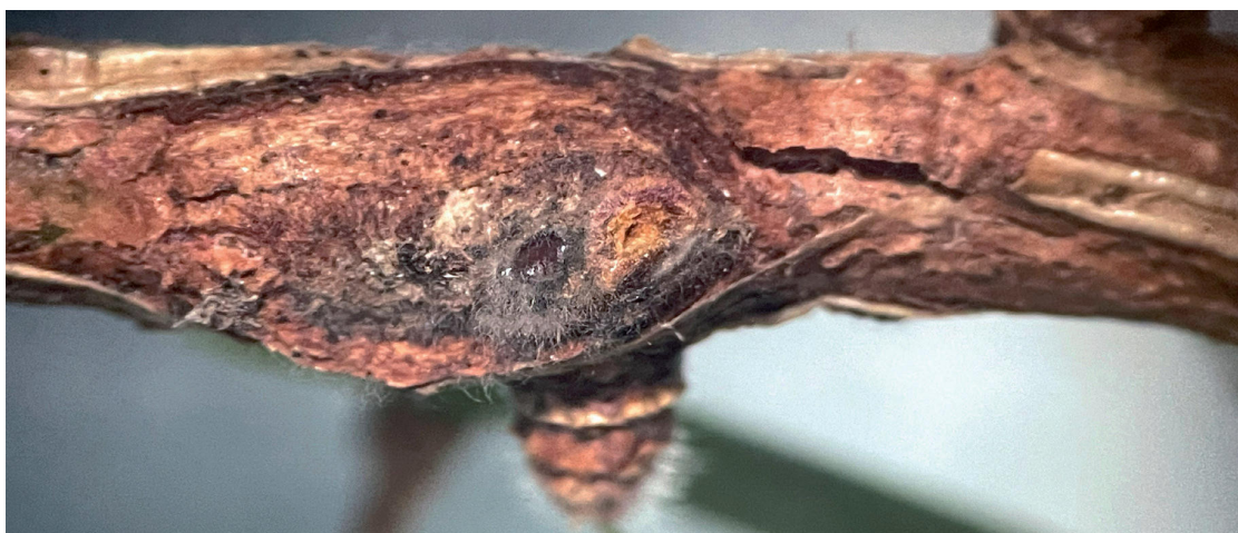
Obrázok 8. Drobné zakalusované poranenia šošovicového tvaru, ktoré sa vyskytujú na vetvičkách napadnutých smrekovcov

Figure 7. The orange fruiting bodies of Lachnellula willkomii , approx. 2 mm in size, are formed in the place of infection of the bark and below it the cancerous thickening of the attacked branch.