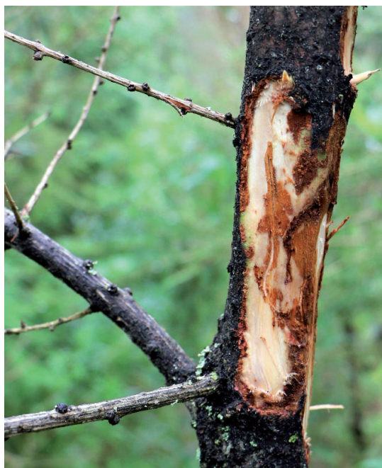
Obrázok 4. Požerok lykožrúta lesklého Figure 4. Galleries of Pityogenes chalcographus