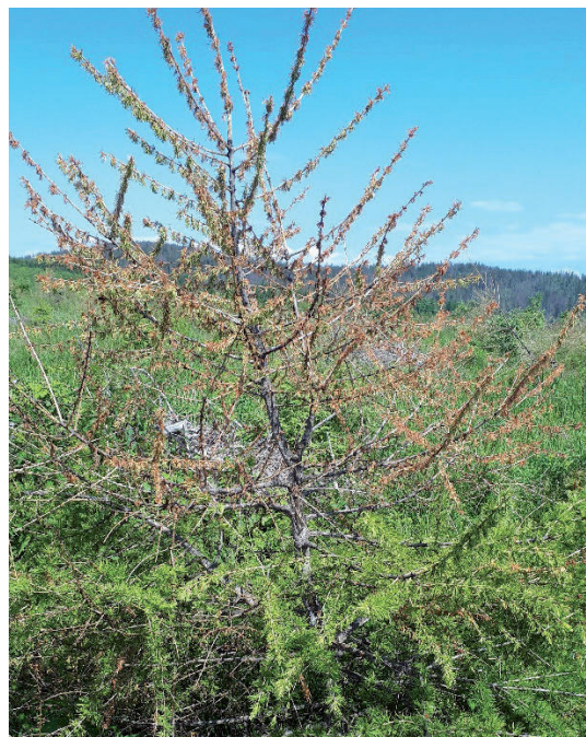
Obrázok 3. Usychanie terminálnej časti Figure 3. Dying of terminal part